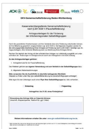
Titelseite des Antragsformulars

Welche Gruppen Anspruch auf die GKV-Förderung haben, können Sie unter anderem auf dem Merkblatt für Selbsthilfegruppen nachlesen. Dort finden Sie auch eine Ausfüllhilfe für den Antrag. Bitte reichen Sie den Antrag im Original ein beim Gesundheitstreffpunkt Mannheim, Max-Joseph-Straße 1, 68167 Mannheim. Antragsfrist ist der 31. März. Den aktuellen Antrag finden Sie hier oder auf der Internetseite des Gesundheitstreffpunkts . Bitte achten Sie darauf, dass Sie den Antrag zuerst mit dem neuesten Adobe Reader herunterladen und dann ausfüllen. Die Antragsumme muss händisch berechnet werden. Wenn Sie Hilfe beim Ausfüllen des Antrags benötigen oder Fragen haben, unterstützen wir Sie gerne. Bitte melden Sie sich dazu beim Gesundheitstreffpunkt unter 0621-339 1818 oder per E-Mail .