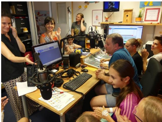
Eindrücke aus dem Studio von Radio RUMMS in der Universitätsmedizin Mannheim.

Noch einmal aufmerksam machen möchten wir Sie auf die Abstimmung für die RheinNeckar HeldenAwards der VR Bank Rhein-Neckar. Unser Radio RUMMS – das Mitmachradio von und für kranke Kinder und Jugendliche in der